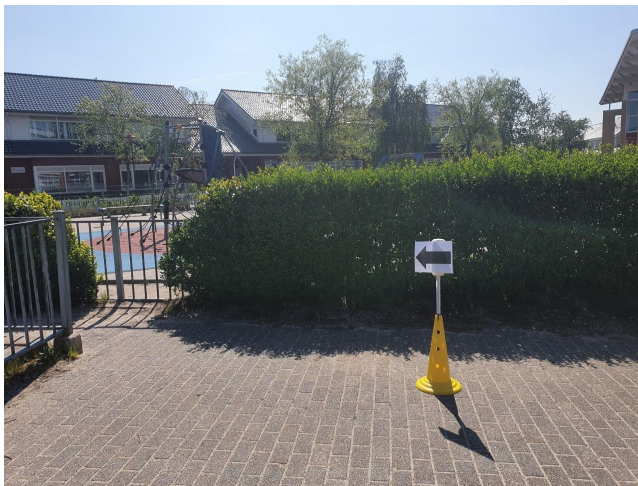
Looproute 1: Kleuters naar buiten.

De kinderen van de groepen 6, 7 en 8 zullen via de voorkant de school verlaten. U kunt uw kind daar opwachten. Spreek eventueel met uw kind een plaats af waar u zult staan.